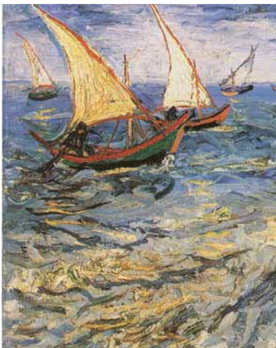
Vincent Van Gogh, Barcos de pescadores , 1888. Bruxelas, Musées Royaux des Beaux-Arts.

Intervenção. Em 2009 você disse na CdO: “Que a caridade penetre nos interstícios dos nossos cálculos é algo que deve estar sempre diante de nós como ideal, como tensão a ter. Porque, sendo todos nós pecadores, não estamos de modo nenhum isentos de decair da gratuidade e acabar no mero cálculo, pensando que somos preservados unicamente porque pertencemos a uma amizade como a nossa. O risco, e não só, de entrincheirar-se numa defesa corporativa daquilo que fazemos, porventura encerrando um projeto de hegemonia política, está sempre à espreita. Que a gratuidade seja a extrema conveniência significa uma disputa em procurar o bem que passa pelo respeito das leis, mas que faz desta gratuidade afeição, construção pelo bem comum, correção sem reticências perante a queda contínua” (J. Carrón, “A sua obra é um bem para todos”, Tracce-Litterae communio-nis , n. 11, 2009, p. VIII). Isto começou a ser para nós um ponto de trabalho. Vou contar um caso. Num recente trabalho institucional fomos chamados a dar o nosso juízo sobre um projeto de lei num prazo apertadíssimo. Isso podia ser uma enorme fonte de queixas: a costumeira administração