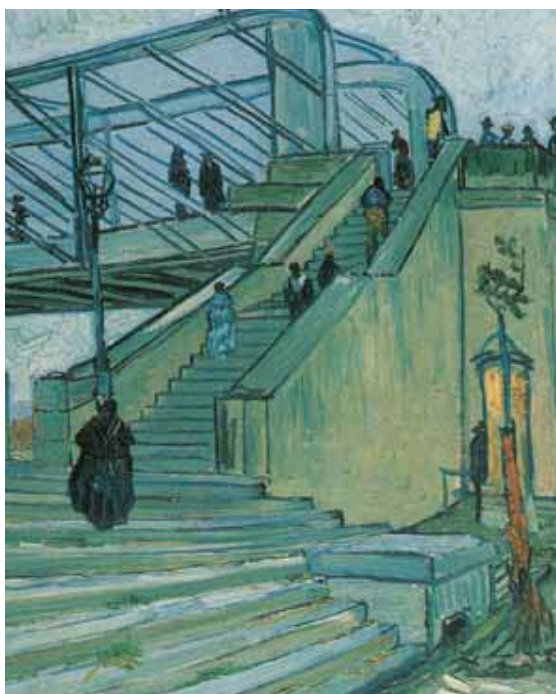
Vincent Van Gogh, A ponte de Triquetaille, 1888 . Coleção particular.

tendem a não perder o objetivo. Mas para muitos, à medida que se cresce, há um desvio de percurso, e quando percebem já não se tem a clareza da missão da obra e da sua origem. O que me preocupa é que a nossa obra cresce cada vez mais, chegam novos voluntários e estes trazem novas propostas de modificação. Esta pressão para mudar tem um aspecto positivo, porque nos põe em movimento e não nos deixa tranquilos; mas traz o risco de afastar-nos da origem e da finalidade da obra. Todos os dias temos combatido batalhas reais para manter viva a missão da obra e por vezes penso não ser capaz de a manter viva muito tempo. Gostaria que você me ajudasse a compreender como posso viver este crescimento natural da obra sem que se afaste da origem nem perca a clareza da finalidade.