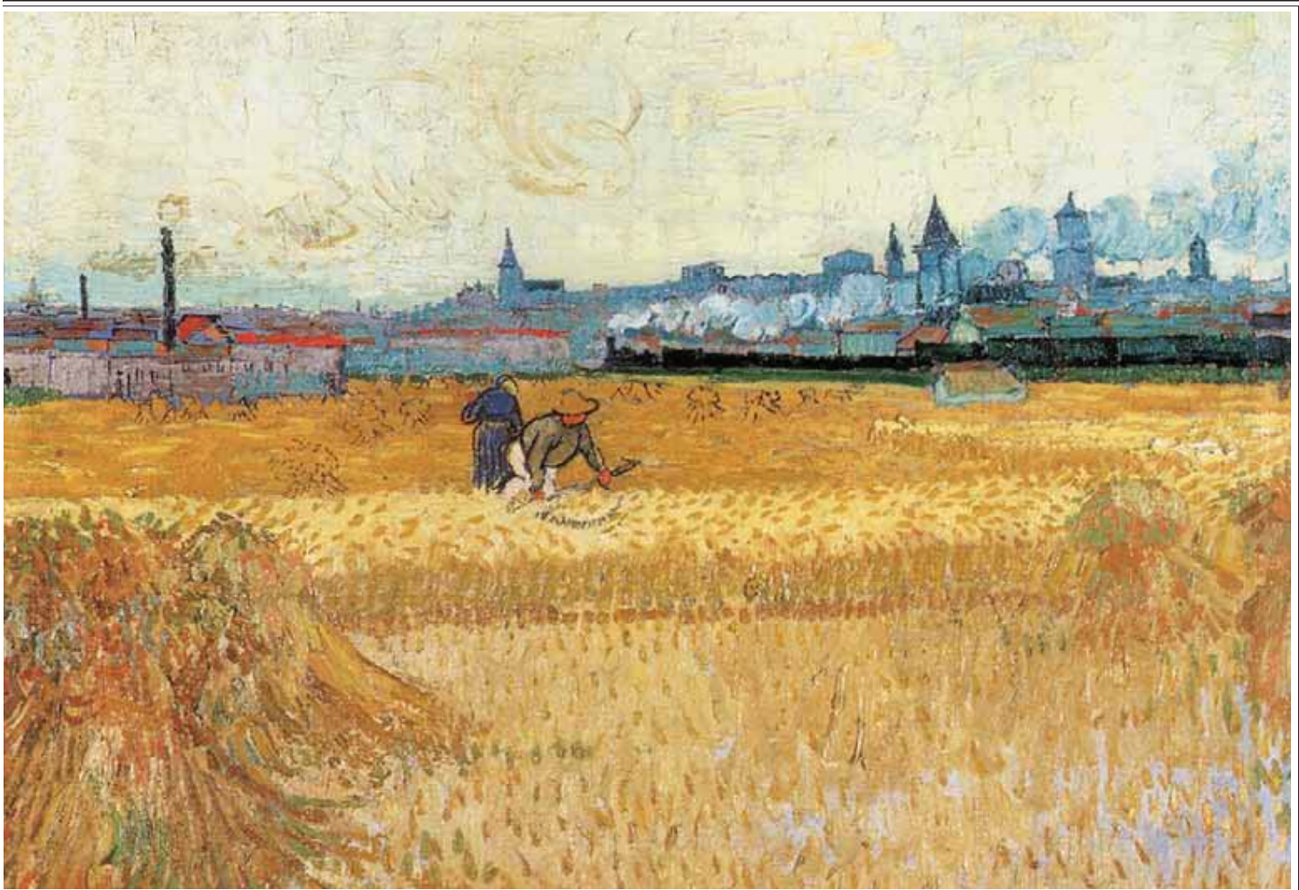
Vincent Van Gogh, Os Ceifeiros , 1888. Paris, Musée Rodin.

perceber – como cada um é capaz de reconhecer logo por experiência própria – para começar a ser livre, é reconhecer que qualquer obra, qualquer tentativa de resposta a uma necessidade é sempre imperfeita. E isto não apenas por sermos pecadores: mesmo o santo mais santo não pode senão fazer uma tentativa irônica. Se começamos a reconhecer a imperfeição de cada ato humano, de cada gesto humano, de cada tentativa humana, então poderemos aos poucos ser livres para começar a ver o que não corre bem, a reconhecê-lo, sem nos sentirmos julgados ou postos em causa somente por isso, porque pertence a cada gesto humano o ser imperfeito. Apesar disto, que todos reconhecemos porque fazemos a experiência disso todos os dias, por vezes – como vocês dizem – estamos dispostos a reconhecer as coisas que correm bem enfatizando os sucessos, mas estamos menos dispostos a reconhecer os pontos críticos. Por quê? Por que há um grande medo. Eu me lembro bem que não havia nada mais desagradável para os professores da escola na qual eu era diretor do que julgar o que acontecia. Eu fazia uma pergunta muito simples: “Um rapaz que vem para a nossa escola, depois de quatro anos, que experiência fez? Podemos dar um