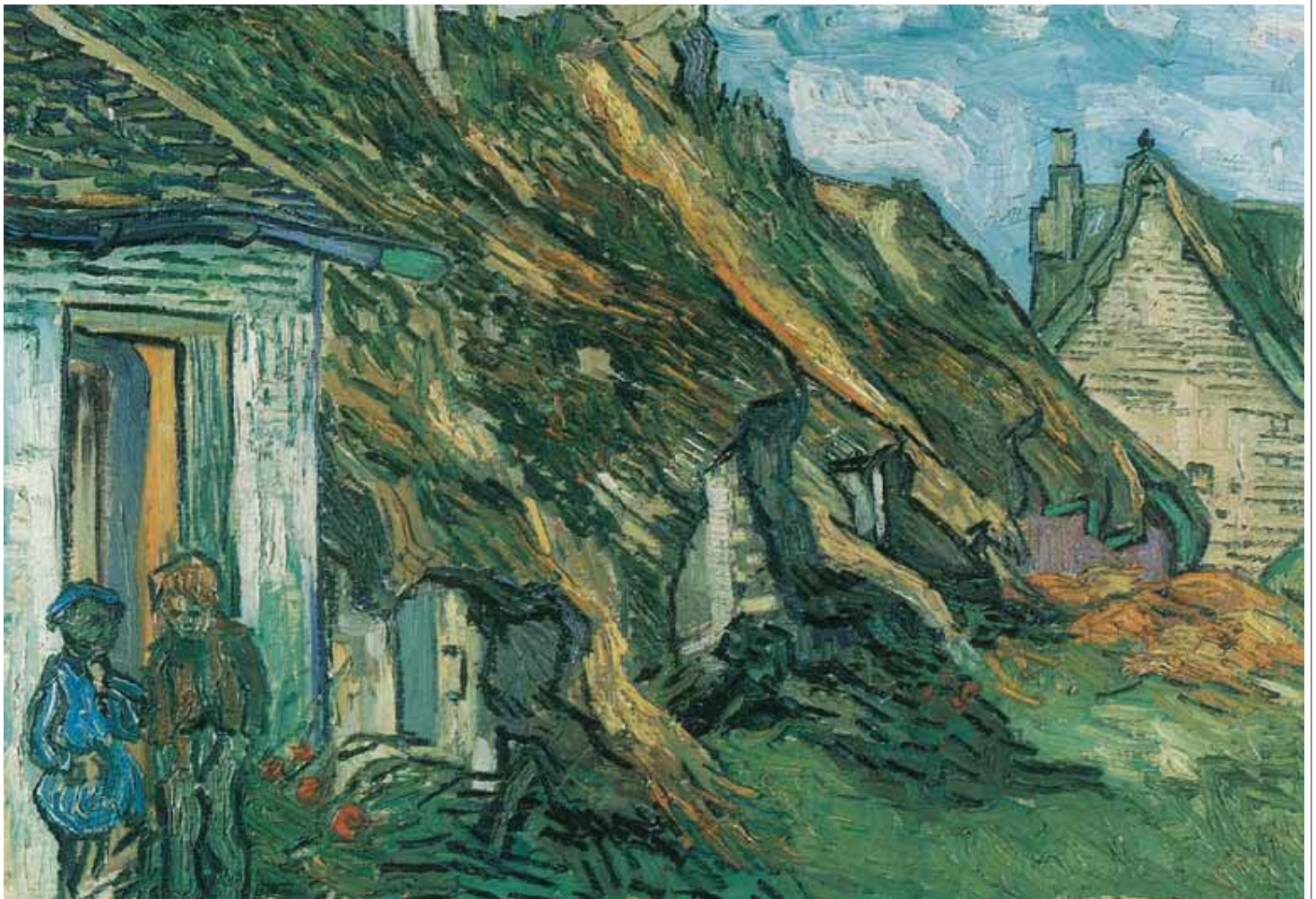
Vincent Van Gogh, Velhos casebres em Chaponval , 1890. Zurique, Kunsthhaus.

Intervenção. Ainda hoje, quando nos pedem para descrever qual é a origem, o ato gerador das nossas obras, normalmente dizemos que nasceram na tentativa de responder a uma necessidade. Mas a experiência ensinou-nos que o desenvolvimento de uma obra não pode ser determinado pela necessidade, e deve ser caracterizado por realismo e prudência. Dom Giussani disse isto também em 1987 em Assago: “As características das obras geradas por uma responsabilidade autêntica devem ser o realismo e a prudência. O realismo está ligado à importância do fato de o fundamento da verdade ser a adequação do intelecto à realidade; enquanto a prudência, que na Suma de São Tomás é definida como um critério reto nas coisas que se fazem, é medida pela verdade da coisa antes ainda que pela moralidade, pelo aspecto ético de bondade. A obra, justamente por tal necessidade de realismo e prudência, torna-se sinal de criatividade, de sacrifício e de abertura” (L. Giussani, O eu, o poder, as obras , São Paulo, Cidade Nova, 2001, p. 164). Por outro lado, sabemos que qualquer atividade que façamos, qualquer atividade humana em geral, contém uma parcela de risco; aquilo a que chamamos “jogar o coração para lá do obstáculo”. E muitas vezes consta-