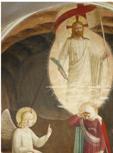
A Ressurreição de Jesus Cristo.

Quando isso penetra até o fundo do nosso ser, enche a vida de letícia. E este é o mais importante indicador que Dom Giussani nos deixa. Quantas pessoas conhecemos realmente felizes? Porque sem letícia não existe geração, não existe presença. É a letícia que liga as duas perguntas, “como se faz para viver?” e “o que estamos fazendo no mundo?”, porque sem uma resposta para a primeira, também não há resposta para a segunda; e, portanto, não existe letícia. Dom Giussani insiste que a condição para gerar é a letícia: “A letícia é o reflexo da certeza da felicidade, do Eterno, e é formada de certeza e de vontade de caminho [uma certeza que nos coloca a caminho], de consciência do caminho que está se realizando [...]. ‘Com esta letícia é possível olhar tudo com simpatia’ [com letícia, com esta letícia é possível gerar as coisas de uma forma diferente] [...], porque olhar com simpatia para alguém que é antipático é gerar uma coisa nova no mundo, é gerar um acontecimento novo. A letícia é a condição para a geração, a alegria é a condição para