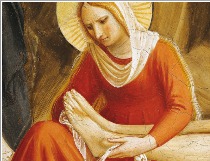
Lamentação sobre o Cristo morto.

» circunstâncias, mas justamente atravessando as circunstâncias, qual é a nossa tarefa. Como sempre ocorreu na vida do Movimento, recordamos Dom Giussani, e agora podemos compreender muito melhor o que ele nos dizia em 1976, porque o ano de 1976 foi o resultado de ter atravessado momentos da vida do Movimento em que tinha vindo à luz o que significava o nosso estar no mundo; ele então dizia que existem duas possibilidades de estar presentes na realidade: como “presença reativa”, isto é, que resulta de uma reação nossa, ou como “presença original”, isto é, que nasce daquilo que nos aconteceu.