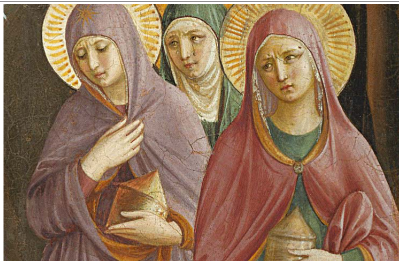
Santas mulheres no sepulcro.

“A utopia tem como modo de expressão o discurso, o projeto e a busca ansiosa de instrumentos e de formas de organização. A presença tem como modo de expressão uma amizade operante, gestos de uma subjetividade diferente que se