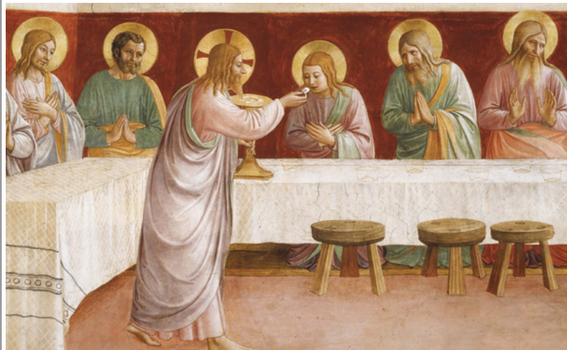
Comunhão dos Apóstolos.

» no primeiro dia, por esta pergunta no jornal Corriere della Sera : queremos nos converter numa facção ou queremos testemunhar uma presença original?