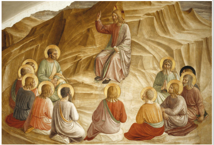
Sermão da Montanha.

E isso tem nos acompanhado nesta passagem, a par dos juízos de Carrón, dos juízos que têm surgido entre nós no caminho da nossa companhia durante o ano, em particular por ocasião